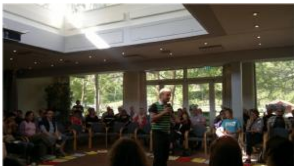
Får formanden en lys idé - eller er det lysindfaldet?